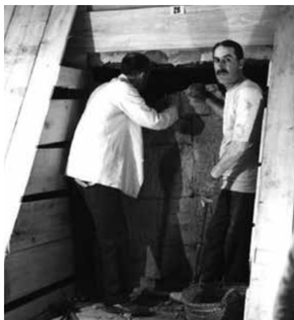
Howard Carter při práci v pohřební komoře

Brzy si byli všichni jistí, že objevili hrobku krále Tutanchamona. První článek o nález hrobky vyšel 30. listopadu 1922 v anglických Timesech. Senzační objev byl oslavován v médiích po celém světě. Howard Carter dal okamžitě dohromady odborný tým. Jednotlivé prostory hrobky byly důkladně vědecky katalogizovány a vyčištěny. Tyto práce trvaly 10 let a z hrobky bylo vyneseno přes 5900 předmětů. Výstava TUTANCHAMON – JEHO HROBK A POKLADY ukazuje komory hrobky přesně tak, jak je Howard Carter a lord Carnarvon objevili.