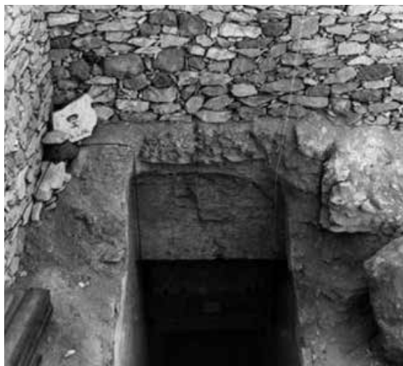
Schody vedoucí do Tutanchamonovy hrobky

Údolí králů leží ve městě mrtvých (pohřebišti) na západním břehu Nilu naproti Thébám (dnešní Luxor). Údolí se stalo místem pohřbu téměř všech králů Nové říše (18. až 20. dynastie, 1543 až 1069 př. n. l.). Tutanchamonoova hrobka a předměty, které v ní byly objeveny, nám umožňují nahlédnout do života ve starém Egyptě. Objev téměř nedotčené faraonovy hrobky se stal obrovskou senzací.