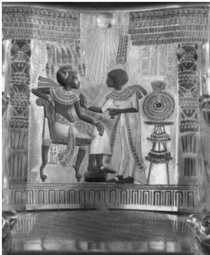
Detail opěradla zlatého trůnu krále Tutanchamona

Faraon Tutanchamon se oženil s Anchesenamom, třetí dcerou faraona Achnatona a Nefertiti, tedy se svou starší nebo nevlastní sestrou. Tutanchamon vládl pouze devět let. Za jeho vlády se hlavním městem království stala Memfida. Egypt se navrátil ke starým bohům, čímž zrušil otcovu víru v jednoho boha. V chrámu v Karnaku byla vztyčena obrovská stéla, na které Tutanchamon oznámil svůj návrat ke starému náboženství. Théby se staly náboženským střediskem Egypta. Tutanchamon stál v čele dobře organizovaného státu. O administrativu se staralo mnoho úředníků. Kněz Aje, který byl pravděpodobně otcem královny Nefertiti, byl jedním z nejdůležitějších rádců Tutanchamona. Generál Horemheb byl velitelem ozbrojených sil. Země se pod Tutanchamonovou vládou vrátila ke svým starým tradicím. Tento návrat byl důležitým krokem ke stabilizaci království. Když Tutanchamon na jaře roku 1323 př. n. l. zemřel ve věku pouhých 18 let, vystřídal ho na egyptském trůnu jeho rádcé Aje.